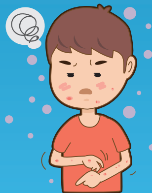
อาการคัน เป็นลมพิษ