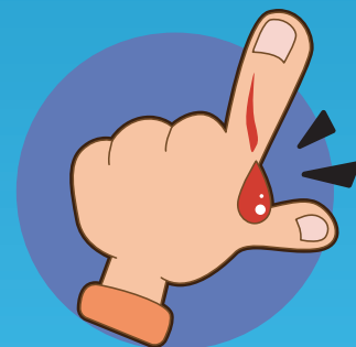
แผลเลือดออก

คำเตือน : หากเจ็บป่วย ไม่สบาย ไม่ควรซื้อยามากินเอง