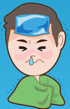
หวัด-เจ็บคอ

ร้อยละ 97 ของคนที่เป็นหวัด-เจ็บคอ ท้องเสีย และแผลเลือดออก หายเองได้ ภายใน 5-7 วัน