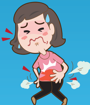
ท้องเสีย